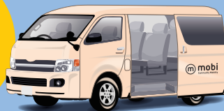
※画像はイメージです。車両タイプは変更になる場合がございます。